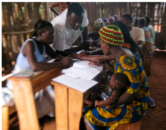
Les apprenants de la 1 ère année font des exercices.