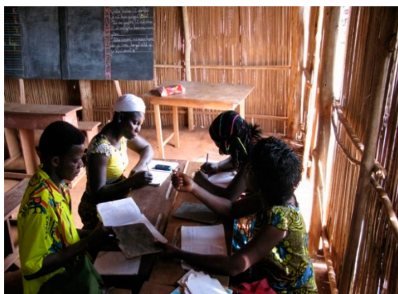
Les Apprenants font des exercices. (20.5.2012)