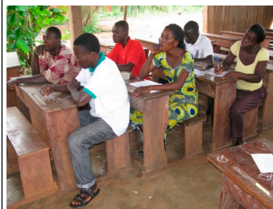
Les apprenants recopient la leçon du jour. (19.7.2012)