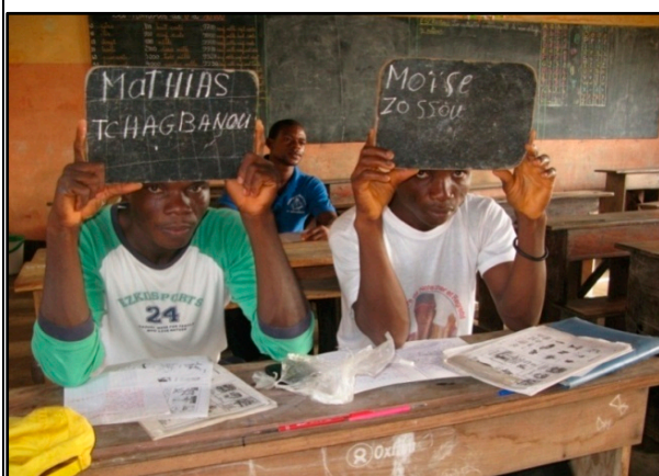
Les apprenants de la 3 ème année montrent leurs ardoises.