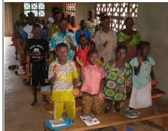
Les apprenants de la 1 ère année chantent. (30.9.2012)