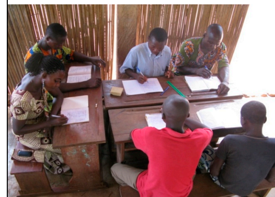
Les apprenants de la 2 ème année font la dictée.