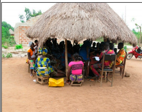
Les participants à une séance d'animation sur l'économie familiale.