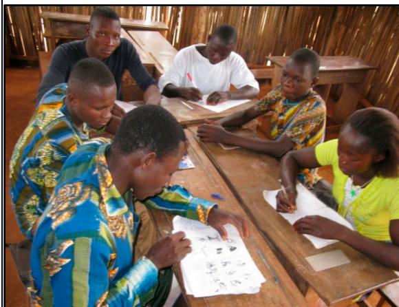
Les apprenants de la 2 ème année sont au cours de lecture.