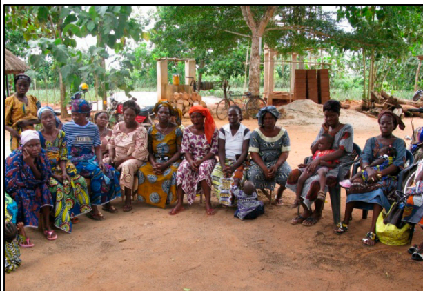
Vue partielle des participants à une séance sur les aliments nutritifs aux enfants.