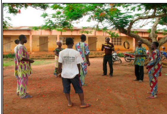
Des participants à une séance d'animation. (Togoudo, 15.5.2012)