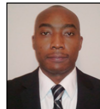
Chifundo Moya Secrétariat