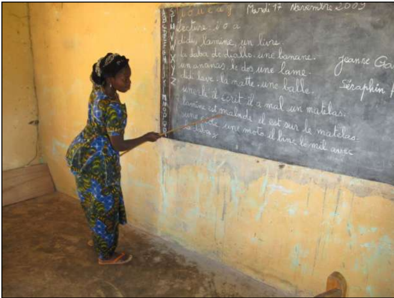
Une apprenante fait la lecture au tableau. 17.11.2009