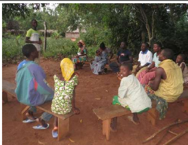
Les bénéficiaires de la localité d'Amigbatin suivent une séance d'animation sur les forêts. Amigbatin, 10.6.2014

Plusieurs séances d'animation sur la sauvegarde de l'environnement ont été organisées dans les centres.