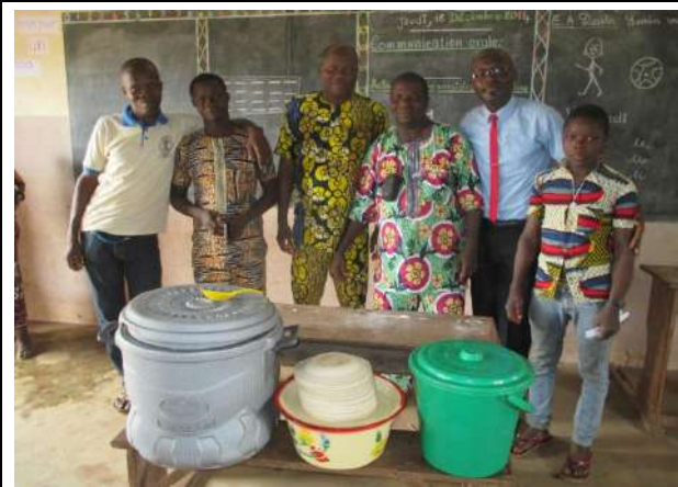
L'équipe de coordination avec le personnel de l'école primaire publique de Mènawa.