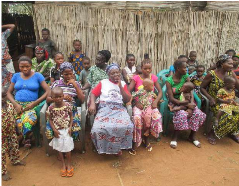
Les bénéficiaires indirects de la localité de Dodji-Dangban sont venus nombreux suivre une animation sur-les droits de la femme. (27.5.2014)