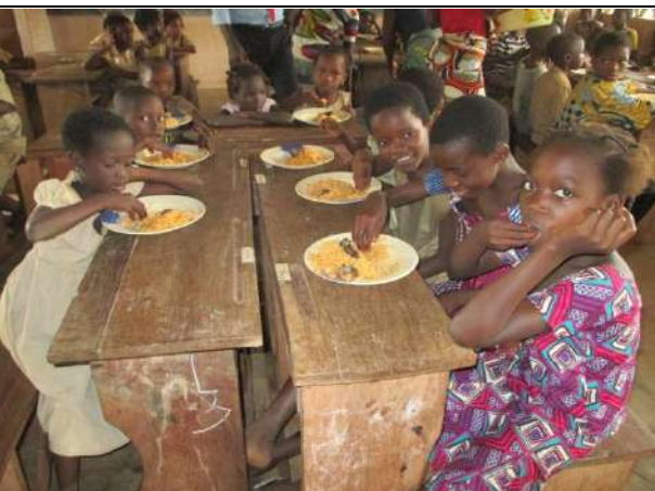
Les écoliers sont contents de bien commencer les congés de la fête de Noël.