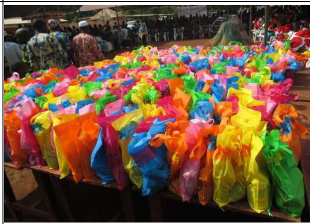
Photo partielle des cadeaux à distribuer aux enfants. (19.12.2014)