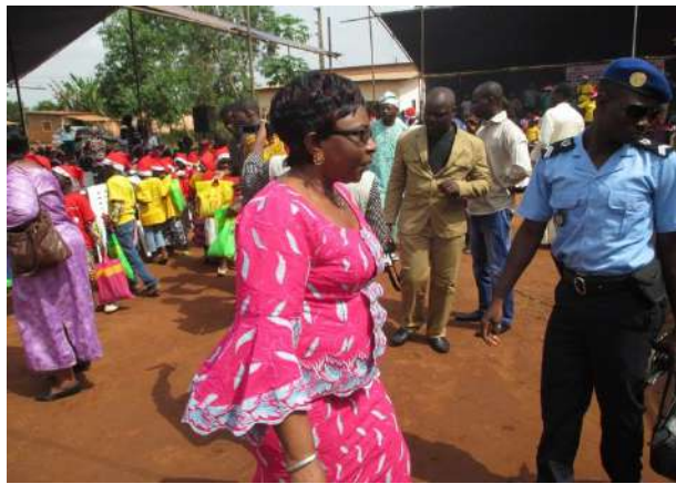
Madame la Ministre a fini de distribuer des cadeaux aux enfants. Elle va rejoindre sa place. (19.12.2014)