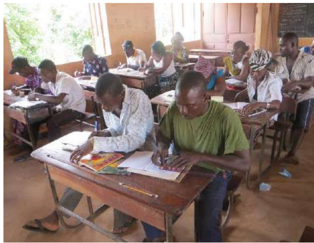
Les apprenants de Sékou 1 ère année font des exercices d'Arithmétique.

Le centre éducatif de Sékou-Centre compte deux classes, la 1 ère année avec un effectif de 20 apprenants et la 2 ème année avec un effectif de 19.