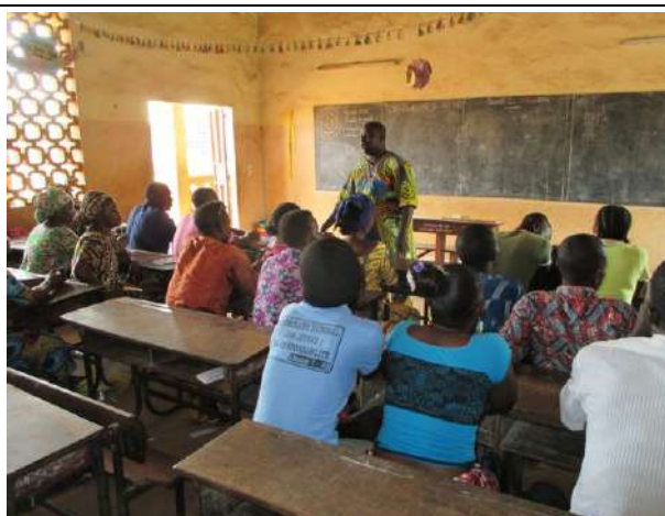
Sensibilisation de quelques patronnes coiffeuses et tisserandes à Amigbatin.