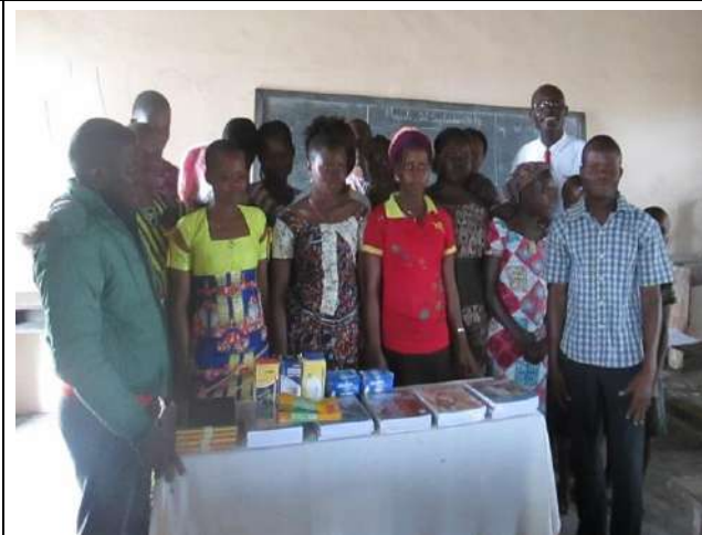
Photo de groupe avec quelques apprenants de Ganvié.