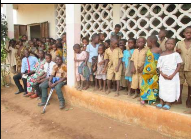
Photo de groupe avec les écoliers de l'école primaire publique de Mènawa. (19.12.2014)