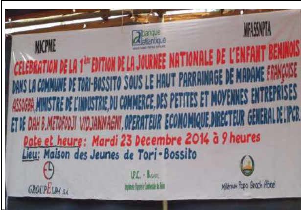
Célébration de la journée internationale de l'enfant béninois ; photo de la banderole de la tribune officielle. (23.12.2014)