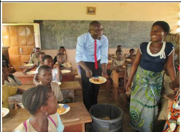
.... Puis il leur sert de la nourriture.