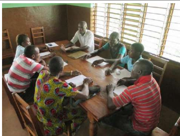
Sensibilisation de quelques patrons et d'ateliers de mécanique à Yokpo. (13 février 2014)

Nous organisons des campagnes de sensibilisation dans les centres cibles et nouveaux centres ciblés. Dans les quatre photos ci-dessous, l'équipe de coordination a rencontré des patrons d'atelier de couture et coiffure, les femmes du marché afin de les sensibiliser sur la nécessité d'alphabétiser leurs apprentis.