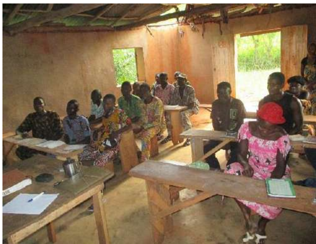
Les apprenants de la 1 ère année sont au cours de langage oral.

Le centre éducatif de Mènawa compte une seule classe, la 1 ère année avec un effectif de 32 apprenants.