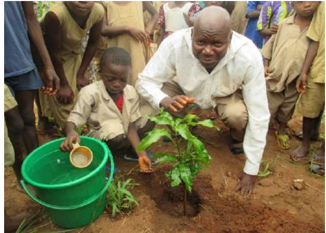
Le Directeur de l'EPP Mènawa a planté un manguier.