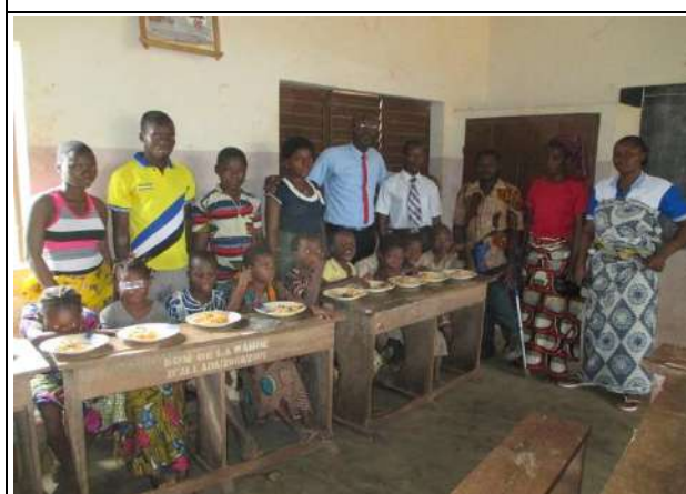
Photo de groupe avec les apprenants du centre de Mènawa venus à la cérémonie. (19.12.2014)