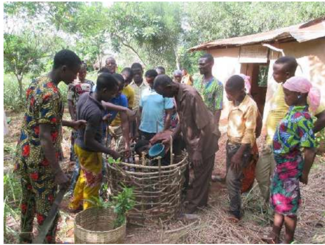
Les apprenants de la localité d'Amigbatin plantent des orangers.

Le reboisement constitue l'une des sous activités de l'éducation communautaire en langues nationales. Environ 90 personnes ont participé à son exécution dans les centres cibles.