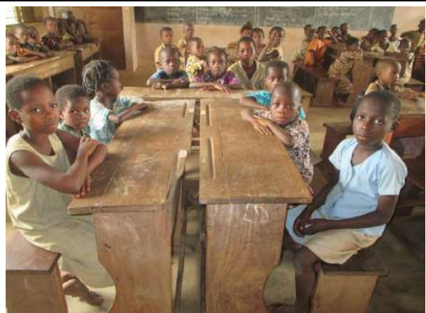
Les écoliers écoutent les conseils de leur directeur au sujet des périodes de fêtes de fin d'année.