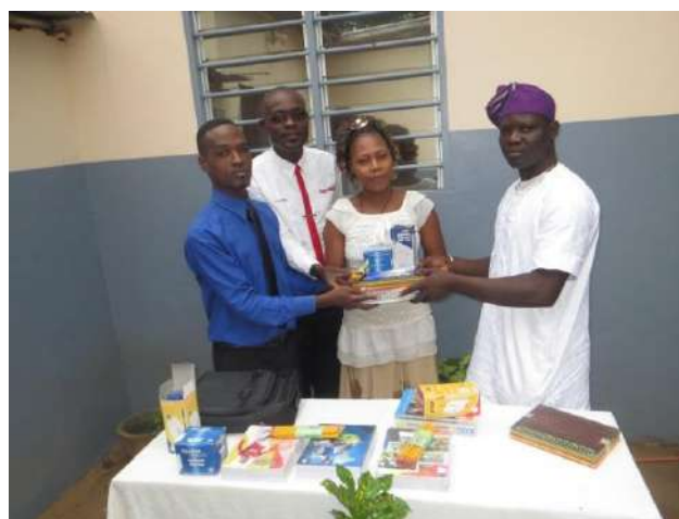
Le personnel de SODEV International-Bénin reçoit des mains du Secrétaire des Ets "Dieu Merci", un lot de fournitures.