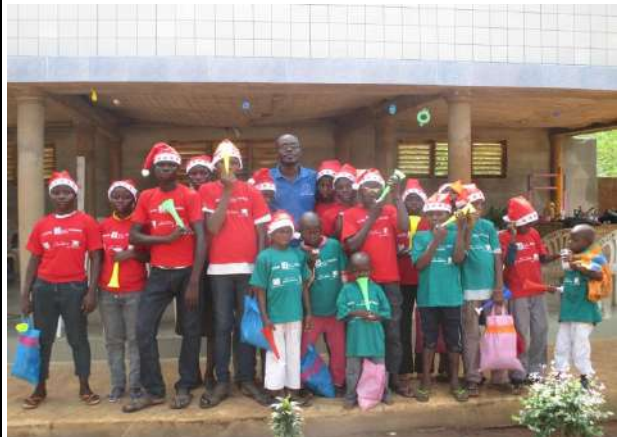
Photo de groupe avec quelques orphelins de l'ONG ACD-ED. (19.12.2014)