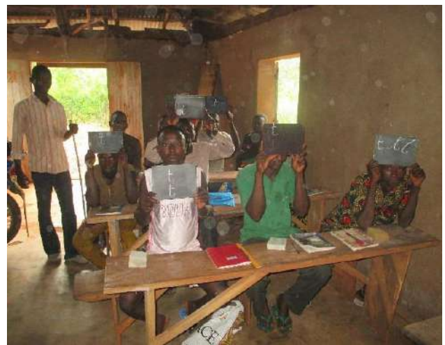
Les apprenants de la 1 ère année ont écrit la lettre t sur leur ardoise.