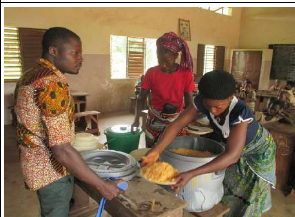
Les apprenantes du centre de Mènawa servent de la nourriture aux écoliers.