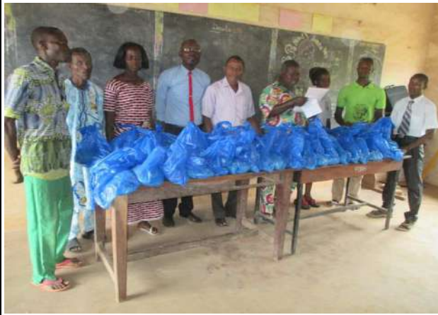
L'équipe de SODEV International-Bénin, le personnel de l'école primaire publique de Sékou et les apprenants bénéficiaires.