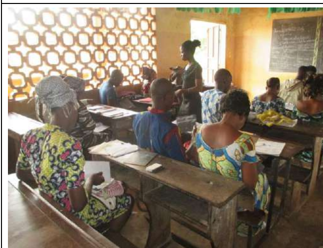
Les apprenants de la 2 ème année sont à un cours d'exercices structuraux.