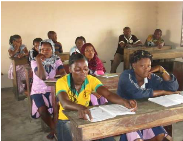
Les apprenants de la 1 ère année écoutent religieusement les explications que donne le formateur sur un cours de français.