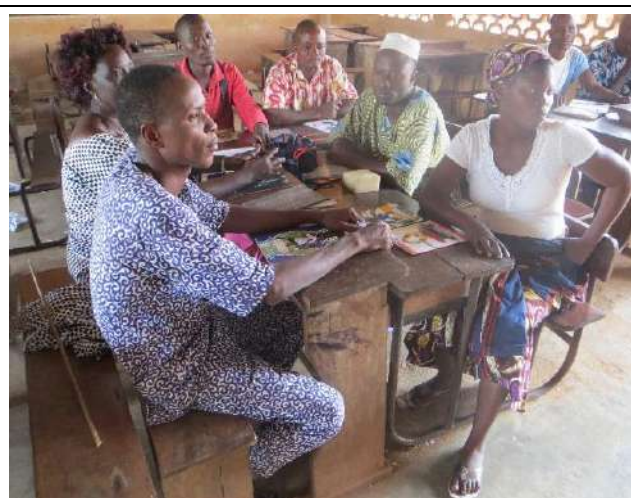
Les apprenants de la 3 ème année sont au cours de problèmes pratiques.