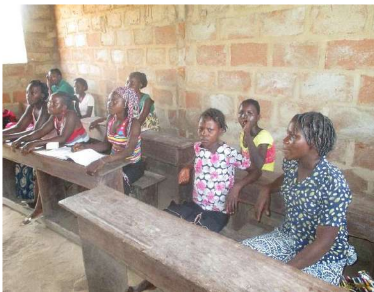
Les bénéficiaires de Hêtin suivent une séance d'animation sur la rougeole. Amigbatin, 10.6.2014