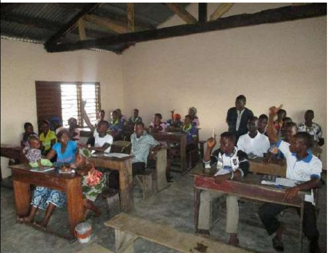
Les apprenants de la 1 ère année lèvent le doigt pour répondre à une question posée par le formateur le langage oral.