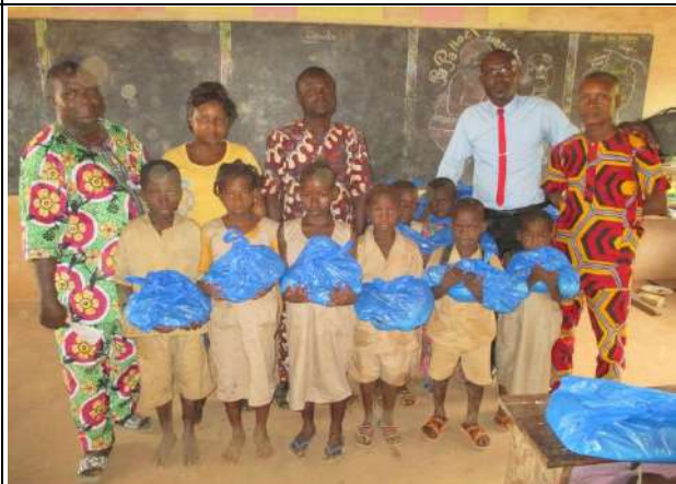
Photo de groupe avec les écoliers de l'école primaire publique de Mènawa. (19.12.2014)