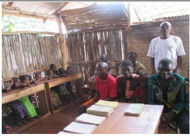
Le Président de l'Association des parents d'élèves remercie SODEV International pour tout ce qu'elle fait pour les enfants de l'école de Sègbèya. (11.4.2014)