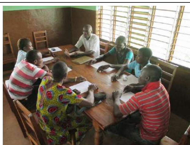
Sensibilisation de quelques patrons et d'ateliers de mécanique à Yokpo. (13 février 2014)

Plusieurs séances de sensibilisation ont été organisées en fonction des sous-activités.