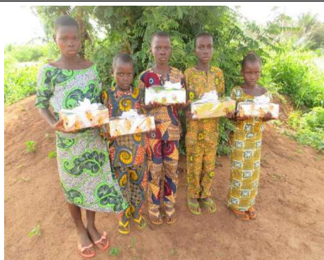
Photo de groupe de quelques bénéficiaires. (11.4.2014)