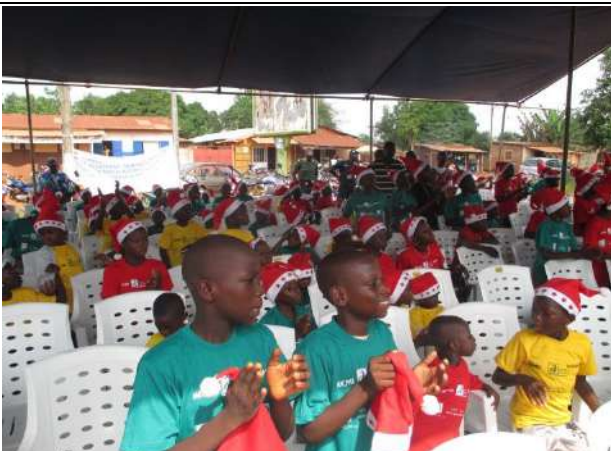
Les enfants applaudissent le Maire à la fin de son allocution. (19.12.2014)